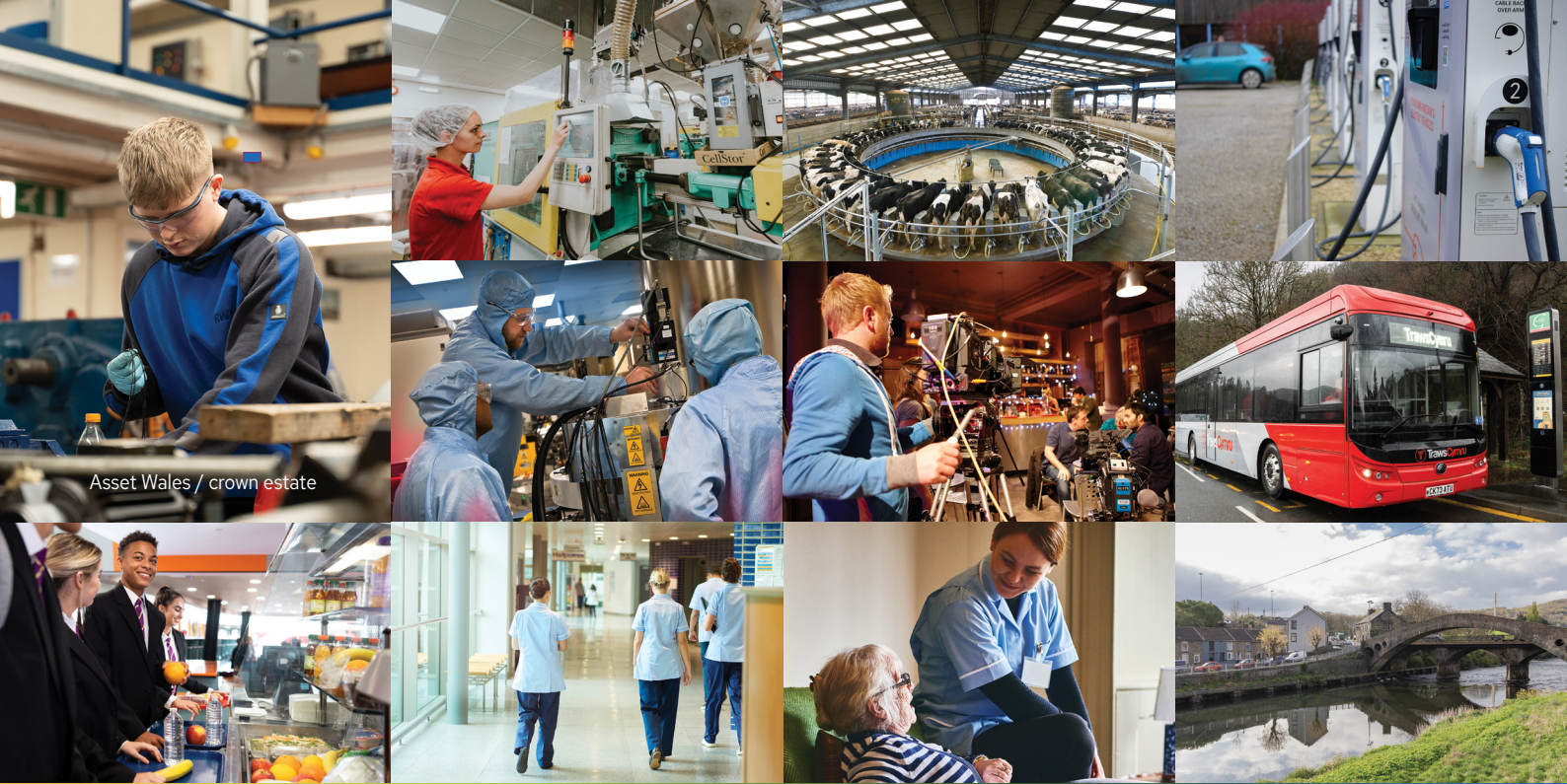
Asset Wales / crown estate

O ddiwydiant i odro, o deithio i deledu, o ysgol i ofal, o iechyd i'r aelwyd, mae angen mwy o drydan gwyrdd arnom - ynni i ffynnu.