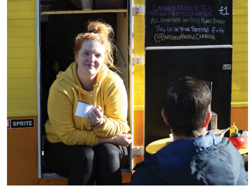
Community caravan cafe.

Mae eich ymatebion yn dangos bod cefnogaeth gref gan y gymuned a dinasysddion i'n pwrpas.