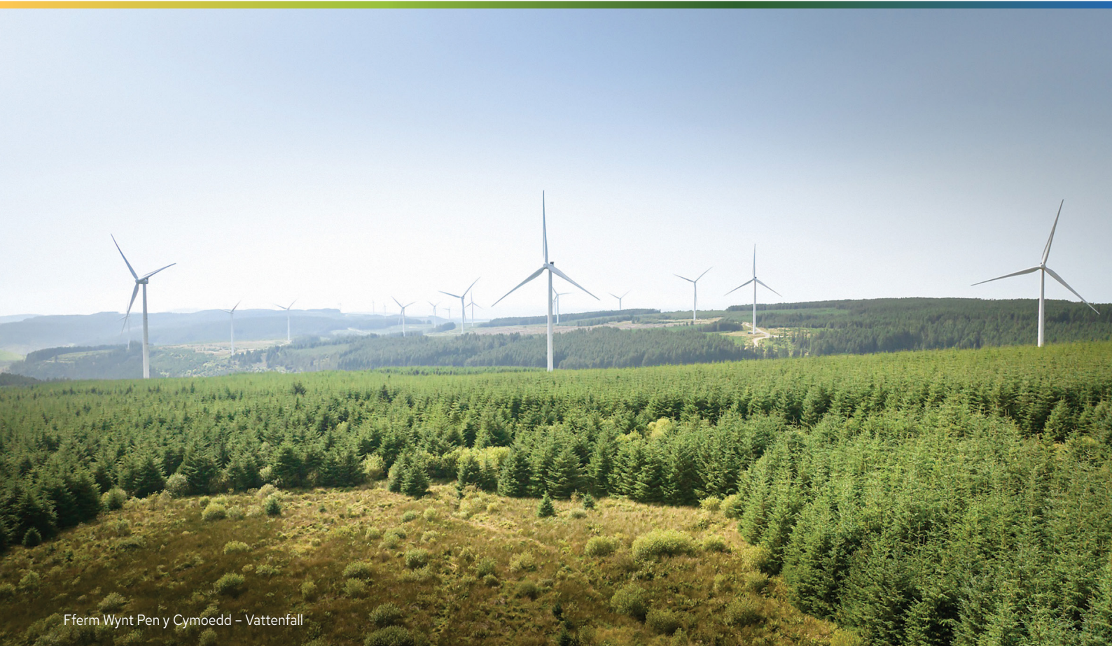
Fferm Wynt Pen y Cymoedd – Vattenfall

Bydd hyn yn flaenoriaeth i Drydan. Mae hefyd yn bwysig arddangos gwaith gwych cymunedau i ddylanwadu a rheoli cyllid cymunedol i ddelifro canlyniadau cadarnhaol iawn yn eu hardaloedd lleol.